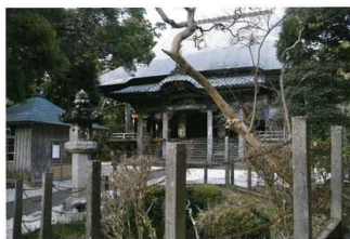
清水寺 本堂 文化14年（1877）再建

いすみ市郷土資料館（田園の美術館） いすみ市弥正 93-1 0470-86-3708 【開館時間】午前9時～午後4時半 【休館日】日曜日（8月13日を除く） 【入館料】無料 【アクセス】 http://www.city.isumi.lg.jp/kyoukaibu/bunko/kyoukaibu.html 【後援】天台宗南総教区研修所