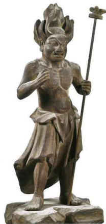
二十八番衆 摩訶菩薩王像（鎌倉時代 市指定文化財）